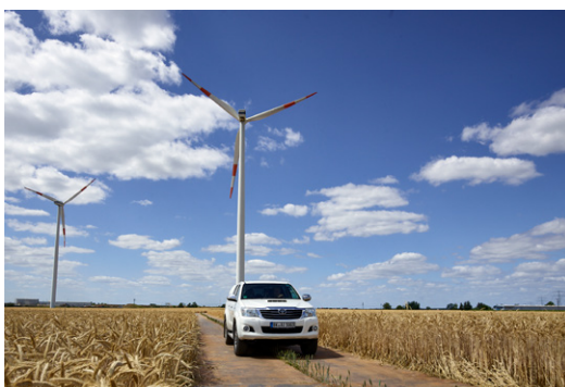
Beim Bau gibt es strenge Regeln, welche Fahrzeuge welche Wege unter welchen Bedingungen nutzen dürfen.