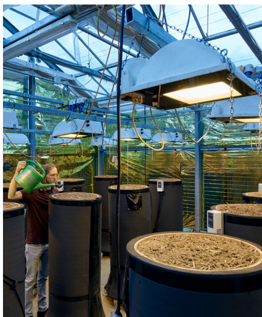
Studie an der Universität Halle-Wittenberg: Heizplatten in den Gefäßen simulieren die Wärme der Erdkabel.

Jeder Zylinder war mit Sonden und Thermometern bestückt. Über drei Jahre hinweg wurden vier für Mitteleuropa typische Kulturen nacheinander angebaut: Sommergerste, Zuckerrübe, Sommerweizen und Luzerne als häufig genutzte Futterpflanze. Dabei wurden die Behälter entsprechend eines ortstypischen feuchten, mittleren und trockenen Jahres bewässert.