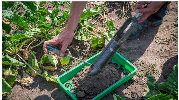
Ortsgenaue Bodenproben sind als Forschungsgrundlage wichtig, um genaue Aussagen über die Auswirkungen des Erdkabels auf den Boden treffen zu können.

Bereits während der Planung war der Bodenschutz wichtiger Faktor: Bei der Trassenfindung wurden schützenswerte Böden in Naturschutzgebieten, zum Beispiel Sumpf- und Mooregebiete, gemieden. Zudem haben Bohrteams entlang des möglichen Trassenverlaufs Bodenproben entnommen, um die Beschaffenheit des Untergrunds ortsgenau zu ermitteln. Ein Bodenschutzkonzept ist Teil des Antrags und legt fest, was zu tun ist, um die natürlichen Bodenfunktionen bestmöglich zu erhalten.