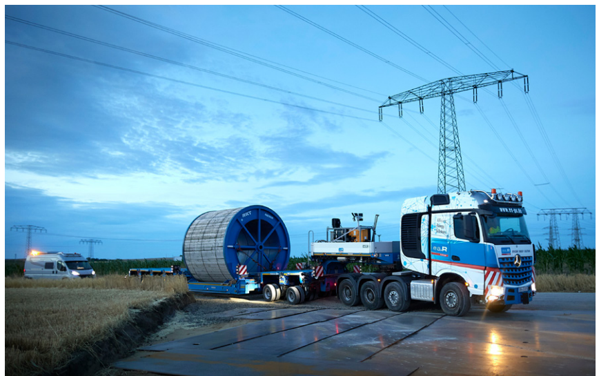
Die Strecke zur Anlieferung der tonnenschweren Kabeltrommeln muss bestimmte Anforderungen erfüllen.

Die Erdkabel für den südlichen, durch Bayern führenden Teil des SuedOstLinks liefert Kabelhersteller Prysmian. Auftraggeber ist hier Projektpartner TenneT.